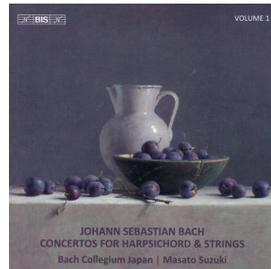
Johann Sebastian Bach, Concertos for Harpsichord and Strings Vol. 1