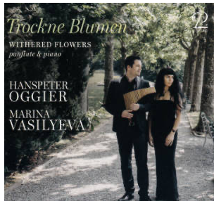
Trockne Blumen, Withered Flowers